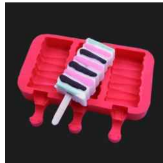
아이스크림 실리콘 몰드