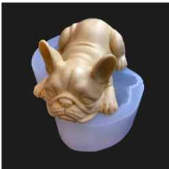
무스 케이크 몰드

이 백금 촉매 부가형 실리콘 시리즈는 탁월한 부드러움과 손쉬운 탈형성으로 높은 평가를 받고 있습니다. 특히 단순한 일체형 몰드 제작에 적합합니다. 대표적인 용도로는 비누, 양초 및 베이킹, 초콜릿, 사탕, 케이크를 위한 다양한 식품 등급 몰드가 있습니다.