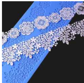
장식용 레이스 몰드