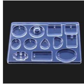
レジンジュエリー型